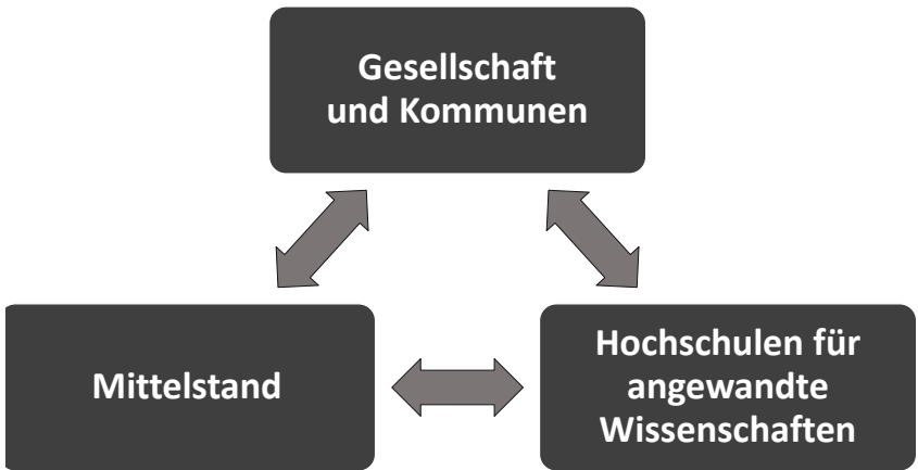
Abbildung 2: Regionale Innovationsökosysteme